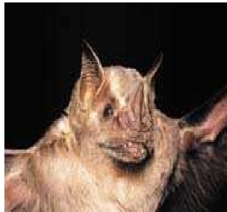
FIGURA 9. Artibeus planirostris