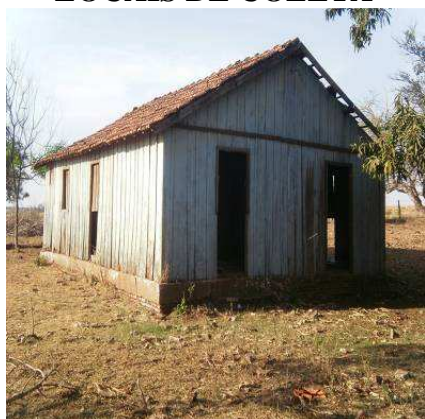
FIGURA 1. Casa abandonada próxima às mangueiras.