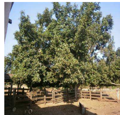
FIGURA 3. Sitio de coleta: figueira com frutos e chiqueiro