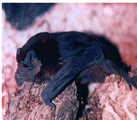
FIGURA 14. Molossus molossus