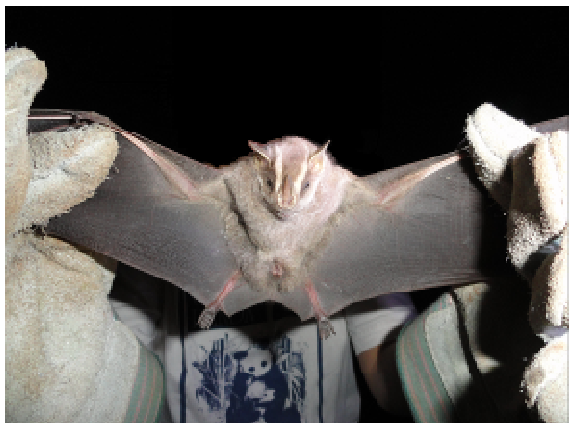
FIGURA 11. Chiroderma doriae