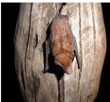
FIGURA 13: Molossops temminckii