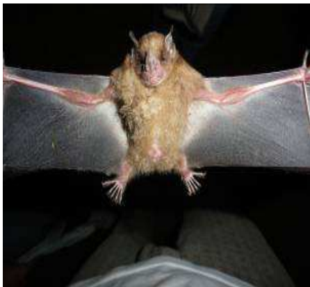
FIGURA 7. Sturnira lilium

http://www.morcegolivre.vet.br/artibeusplanirostris.html