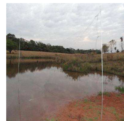
FIGURA 4. Rede de neblina armada em Açude.