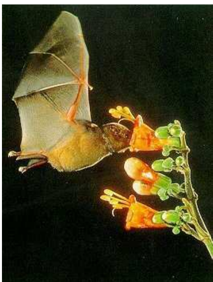
FIGURA 12. Glossophaga soricina