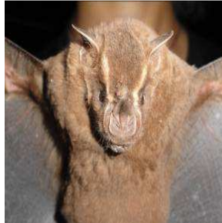
FIGURA 8. Artibeus lituratus