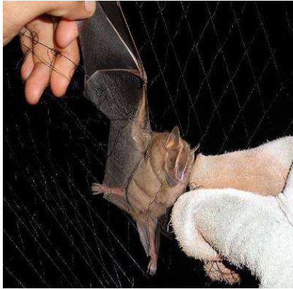
FIGURA 5. Morcego filostomídeo capturado em rede de neblina armada sob figueira.