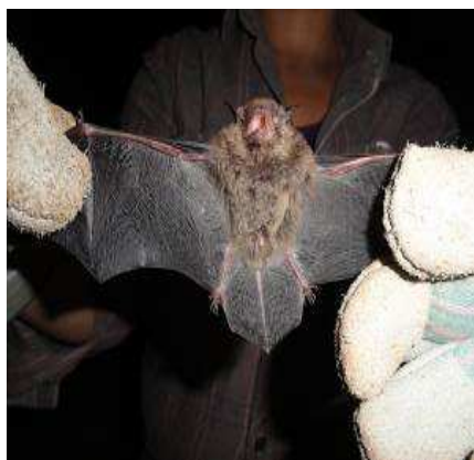
FIGURA 15. Myotis nigricans