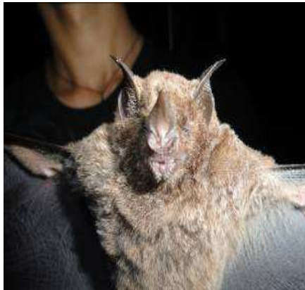
FIGURA 6. Carollia perspicillata