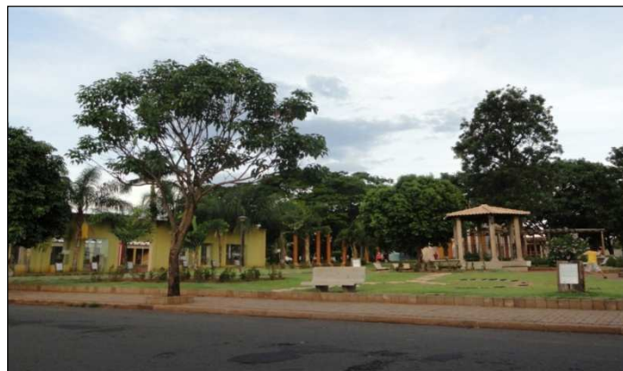
FIGURA 2: Foto da Praça Calisto R. Garcia, evidenciando o flora local.

Uma das praças estudadas neste trabalho está representada na figura 2. No inventário total das cinco praças de Santa Fé do Sul-SP analisadas, foram catalogadas 27 espécies pertencentes a 20 famílias botânicas. Num total de 2.307 indivíduos arbóreos e arbustivos amostrados, as espécies de maior frequência foram Ixora coccinea com 61,86% (1427 indivíduos) e Duranta repens aurea com 10,27% (237 indivíduos) (TABELA 1).