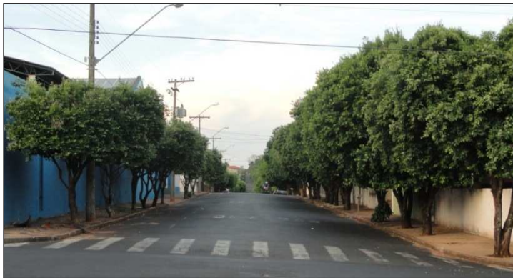
FIGURA 4: Amostra de uma rua do centro, evidenciando a abundância de oitis ( Licania tomentosa ).

Portanto, é necessário um aumento na variedade de espécies nos passeios públicos, sobretudo espécies frutíferas compatíveis com a arborização das vias públicas, que poderiam contribuir para o aumento da diversidade da flora local além de servir de abrigo e alimentação para a fauna local.