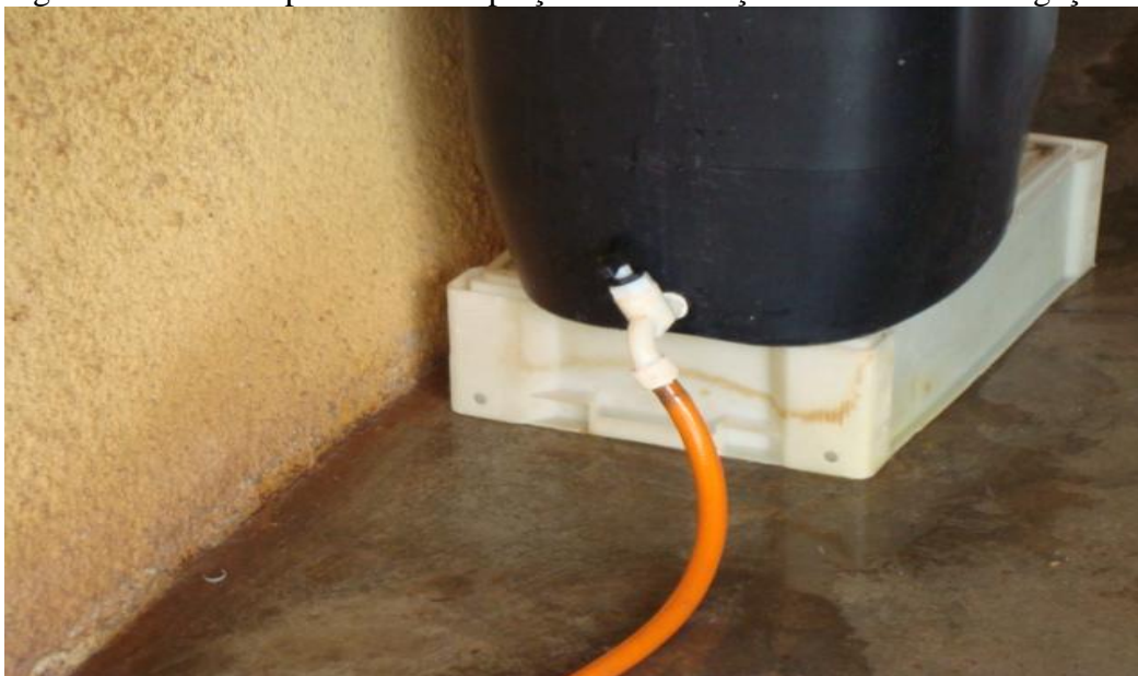
Figura 3 - Início do processo de captação e alimentação do sistema de irrigação