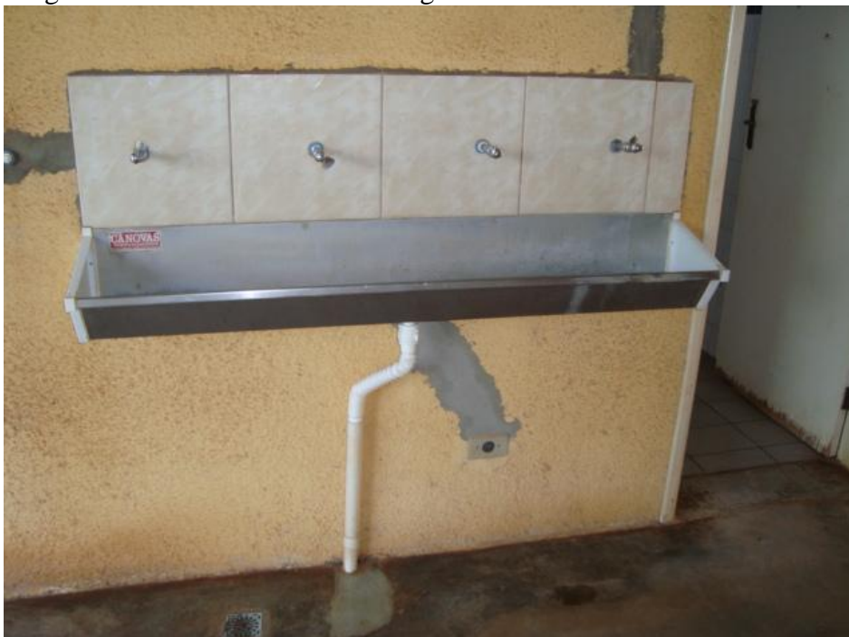
Figura 1 - Bebedouro - sistema original

A Figura 1 apresenta o bebedouro e suas instalações de forma original, ou seja, antes da implantação do experimento.