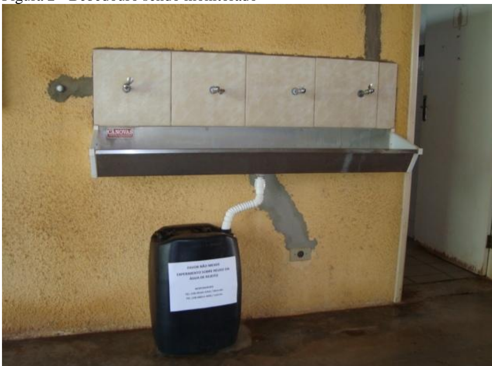
Figura 2 - Bebedouro sendo monitorado