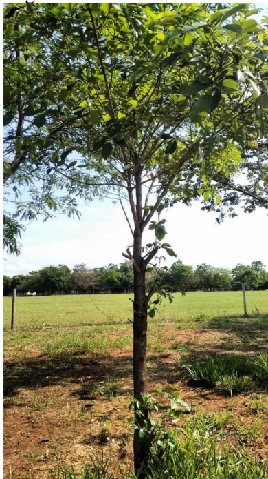
Figura 7 – Tarumã