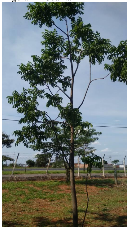
Figura 4 – Guaritá