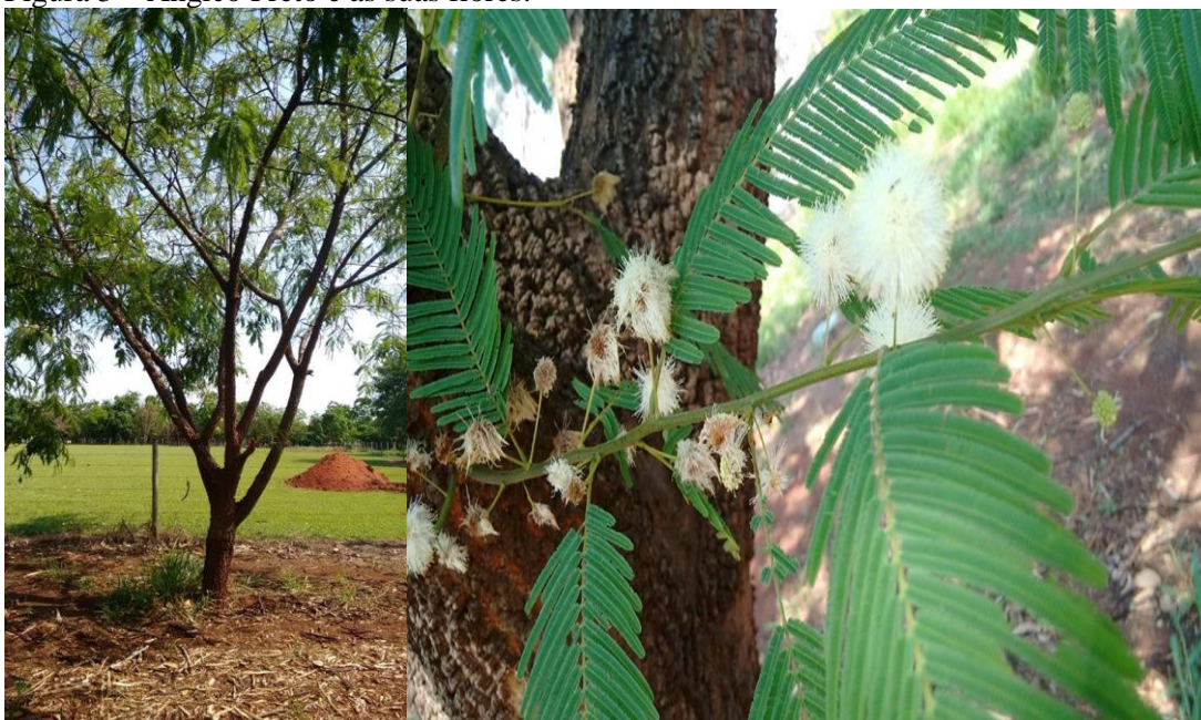
Figura 3 – Angico Preto e as suas flores.