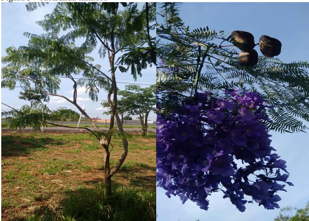
Figura 5 – Jacarandá-mimoso