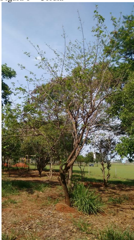
Figura 6 – Cordia