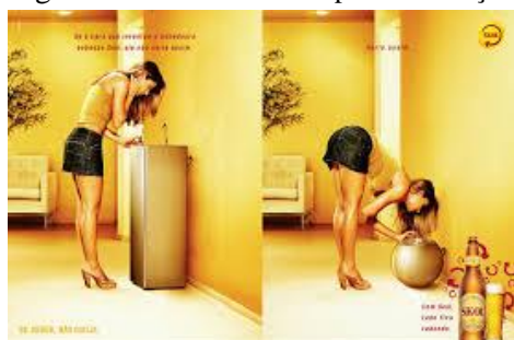
Figura 1 - Amostra da campanha Invenção

Para melhor interpretação e apresentação de Invenções , alguns panfletos veiculados durante esse período encontram-se abaixo. Após exibir as ilustrações, estas serão descritas e analisadas.