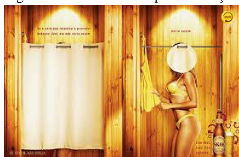
Figura 3 - Amostra da campanha Invenção