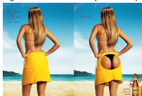
Figura 2 - Amostra da campanha Invenção