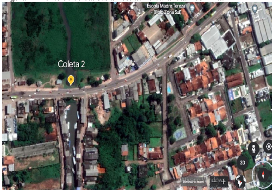
Figura 4 - Ponto de coleta das amostras no canal das Pedrinhas