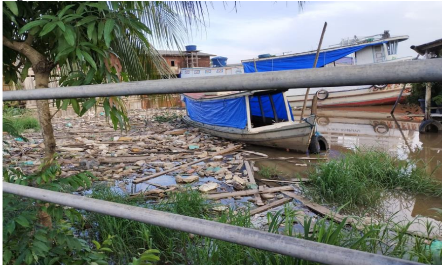
Figura 2 - Canal das Pedrinhas

final de resíduos e esgoto doméstico sem tratamento. O canal possui importância econômica pois transporta pequenas embarcações que fornecem madeira para o comércio local, além de pessoas. Devido à intensa atividade ao redor do canal é visível a pressão antrópica no corpo hídrico (OLIVEIRA et al. , 2016).