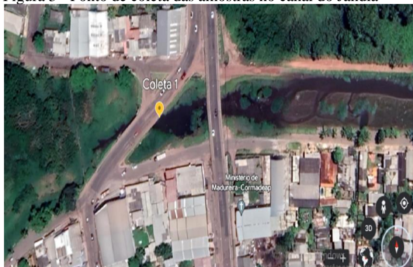
Figura 3 - Ponto de coleta das amostras no canal do Jandiá