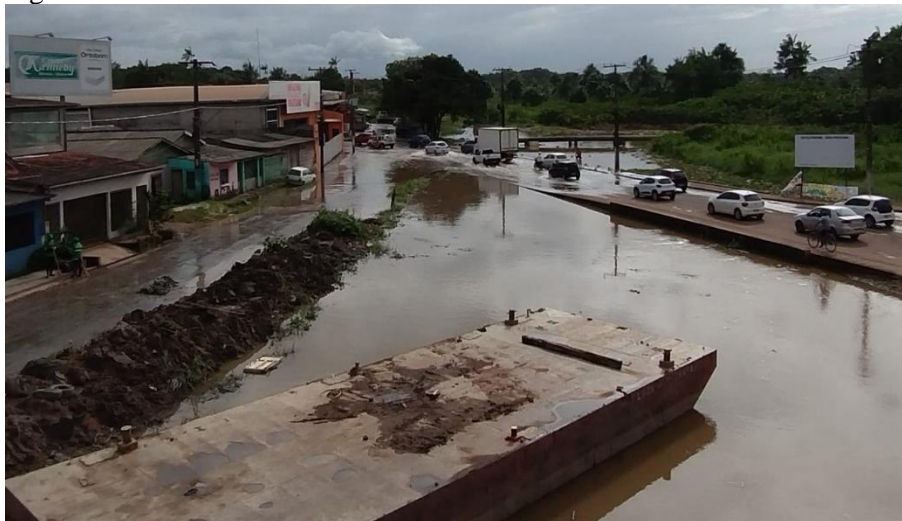
Figura 1 - Canal do Jandiá

Segundo Cardoso et al. (2015), o canal do Jandiá (Figura 1) possui uma extensão de cerca de 4,2 km, abrangendo os bairros: Pacoval, São Lázaro e Cidade Nova de Macapá, e desemboca direto no rio Amazonas. Sua área total é de 2.380.156,25 m 2 . O canal faz parte do sistema de drenagem dos bairros: Santa Rita, Jesus de Nazaré e Lagunho (SANTOS, 2017; PICANÇO, 2018). A foz do canal comporta um porto de pequeno porte por onde são transportadas mercadorias que abastecem o comércio local (SANTOS, 2017).