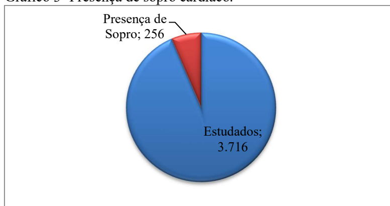
Gráfico 3- Presença de sopro cardíaco.

Os autores Amorim et al. (2008) constataram em seu estudo que a distribuição das apresentações clínicas das cardiopatias foi diferente entre os recém-nascidos vivos, nos quais dominaram a forma isolada e os natimortos, nos quais predominaram a forma associada à anomalia de outros órgãos e sistemas a síndromes distróficas. Isto é descrito na literatura.